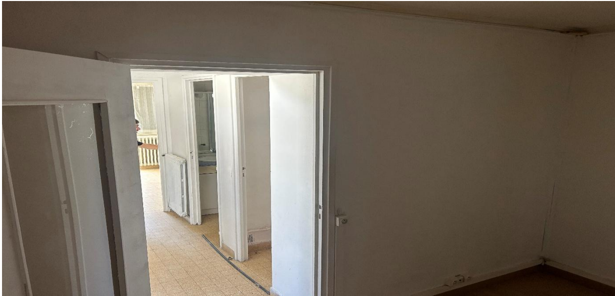
PHOTO D'ENSEMBLE AVANT TRAVAUX